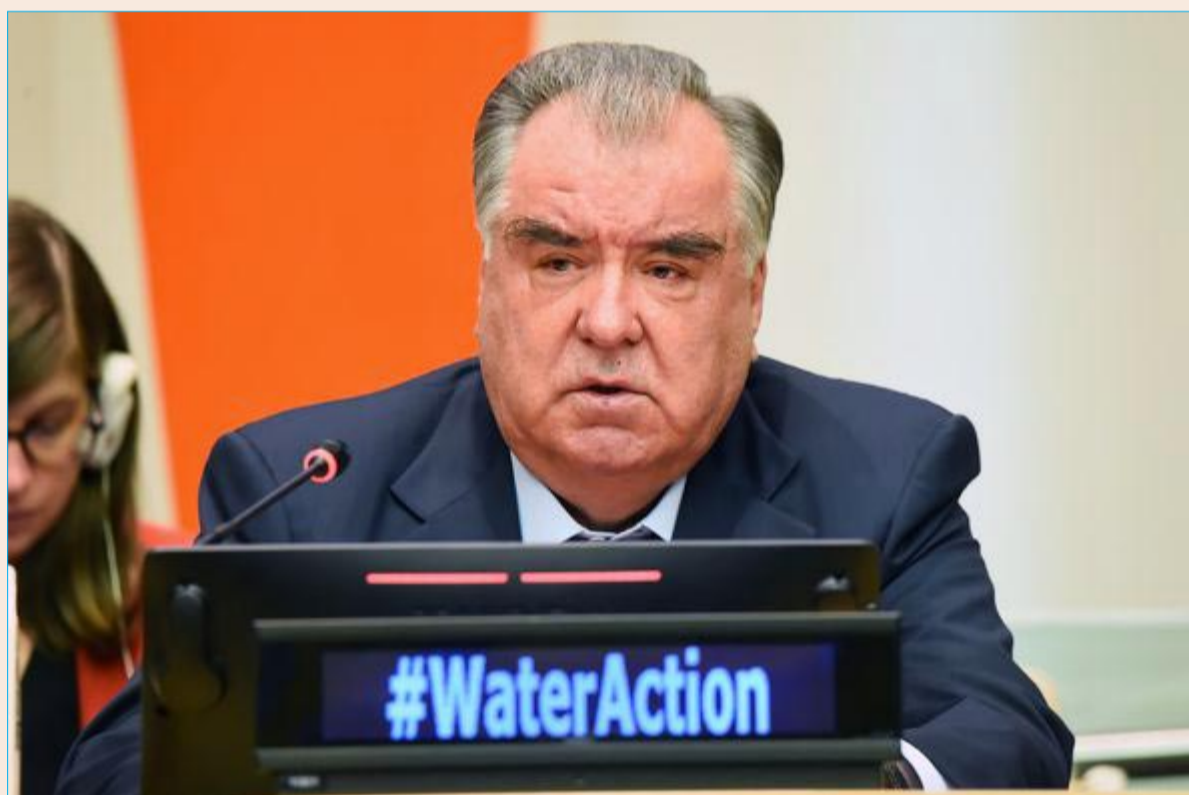
ТОБИШИ ФАРУУ ШУКУҶИ КАЁНИ ЗИ МИНБАРҶОИ БОНУФУЗИ ҶАҶОНИ

E-mail: anvor.donish@kgu.tj Нашрияи Донишгоҳи давлатии Кӯлоб ба номи Абуабдуллоҳи Рӯдакӣ* www.anvor.tj №3 (339) 15-уми апрели соли 2023, шанбе (оғози нашр: соли 1994)