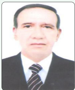
Шажобз КАБИРОВ, доктори илмҳои филологӣ, профессори Донишгоҳи миллии Тоҷикистон

Чун тифл ба дунё меояд, ҳар як модар бо як олам орзуву умед ӯро ё дар сари гаҳвора, ё дар бағал ва ё дар алғунчак бо замзамаи "алла, аллаё" ором мекунад мехобонад.