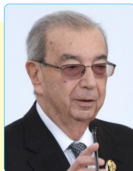
Евгений ПРИМАКОВ, Академик

Президенти Тоҷикистон Эмомалӣ Раҳмон солҳои зиёдест, ки роҳбарии ҷумҳуриашро ба зимма дорад ва мамлакатро ба роҳи дуруст бурд. Ҳамчунин вай дар муътадилсозии авзои дохилӣ мусоидат намуд.