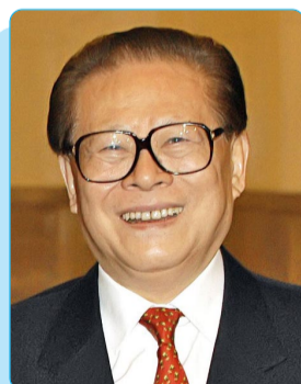
Сзеан СЗЭМИН, Собиқ Раиси Ҷумҳурии Халқии Чин

Мардуми Фаронса ҳеҷ гоҳ мавқеи устувори Президенти Тоҷикистонро, ки ба фарҳанги ғанӣ ва бузурги сиёсиву маънавии халқи тоҷик таъя мекунад, фаромӯш нахоҳад кард.