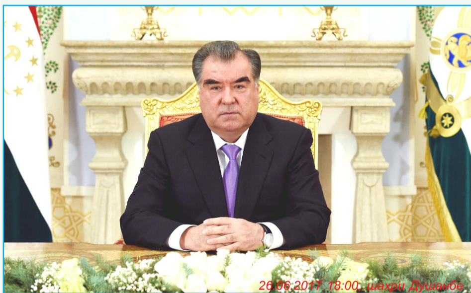
26.06.2017 18:00, шаҳри Душанба