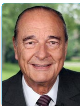
Жак ШИРАК Собиқ Президенти Фаронса

Дар ҳоли ҳозир ҳам аз ҷиҳати обрӯи сиёсӣ ҳам аз ҷиҳати таъсир ба тафаккури мардум ва ҳам аз ҷиҳати меҳру муҳаббати халқ монанди Эмомалӣ Раҳмон лидери дигаре дар Тоҷикистон вучуд надорад ва баробари ӯ ҳам шуда наметавонад. Албатта, ҳастанд ҷавонони лаёқатманде, ки дар сатҳи ҳукумат кор мекунанд ва дар оянда метавонанд ба лидерони қавӣ табдил шаванд. Интихоботи президентӣ ҳам нишон дод, ки чунин лидер мисли Раҳмон нест. Мо ҳаракат мекунем, ки ҳам аз ҷиҳати дониш, ҳам малака ва ҳам мановфеи давлатӣ лидери нав пайдо шавад. Ҳарчанд сиёсатмадорони феълӣ лидерони сиёсӣ ҳастанд, вале сатҳи маҳбубияту донишу авторитети сиёсии камтар доранд.