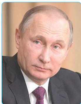
Владимир ПУТИН, Президенти Федератсияи Россия

Эмомалӣ Раҳмон яке аз симоҳои барҷаста буда, дар байни сиёсатмадорони Иттиҳоди давлатҳои мустақил мавқеи намоёнро ишғол мекунад. Ин беҳуда нест. Тамоми ҷидду ҷаҳди ӯ аз он шаҳодат медиҳад, ки дар Тоҷикистон сулҳ тавре пойдор аст, ки назираш дар ҳеҷ мамлакате, ки чунин вазъияти муташаниҷ дошт, дида намешуд. Ҳар он чи оид ба ин масъала дар Тоҷикистон амалӣ гардидааст, мисоли хубест барои бисёр халқҳои мамлакатҳои дигар.