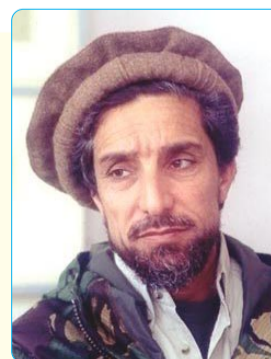
Аҳмадишоҳи МАСЪУД, Қаҳрамони миллии Афғонистон

Истиқлолият ба Тоҷикистон Эмомалӣ Раҳмон - ин сиёсатмадори дараҷаи ҷаҳониро дод. Имрӯз ӯ машҳуртарин фарзанди Тоҷикистон ва дӯсти ҳақиқии Афғонистон аст.